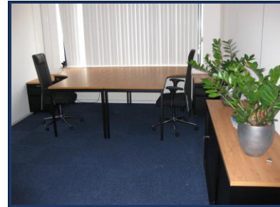
voorbeeld gemeubileerde kantoorunits.