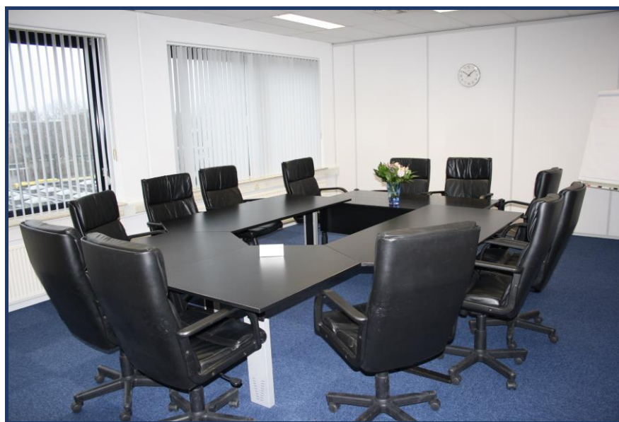
De ontvangst-vergaderruimte staat gratis tot uw beschikking.