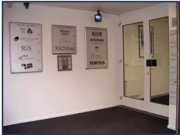
Naamsverwijzing in de entree