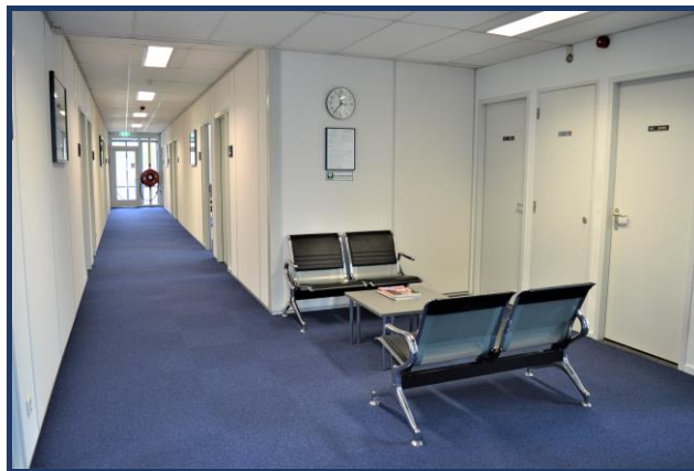
Op iedere etage vindt u een zijte